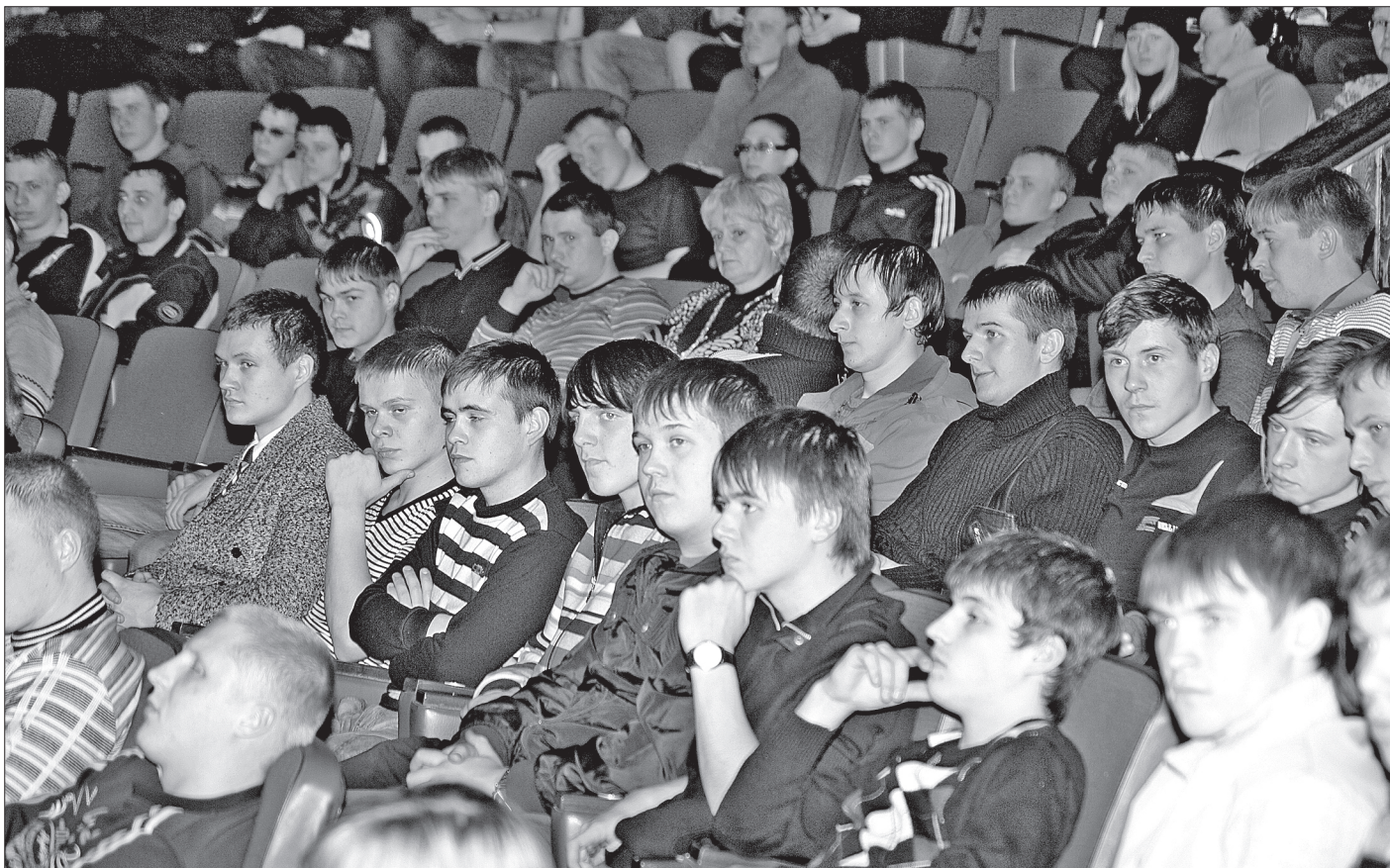
Корабелов Севмаша стало больше

В пятницу вечером в большом зале Дома корабела собрались несколько сотен молодых ребят и девушек. Здесь прошел ставший уже традиционным праздник «Посвящение в рабочие».