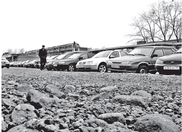
Пока что гравий на половине стоянке