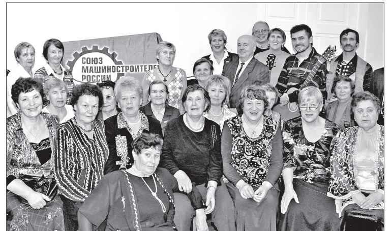
На встрече ветеранов цеха 11