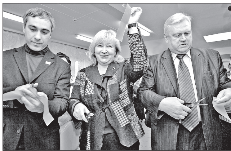
Новое отделение открыто

Кабинет гинеколога работает в рамках клиники