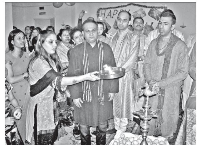
Огонь в конце молитвы означает очищение души

Индийские офицеры группы наблюдения за переоборудованием авианосца «Викрамадитья» и их семьи провели фестиваль зажигания огня.