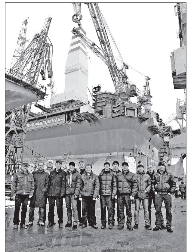
Конструкторы помещений возле «Приразломной»