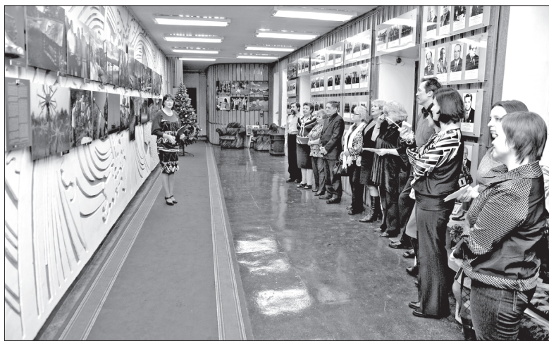
Открытие выставки в музее Севмаша

Работавший во многих центральных газетах и журналах фотограф объездил полмира. И нашел свое вдохновение на Русском Севере, в Кенозерском национальном парке. На выставке представлены работы, не столько отражающие красоту Кенозерья, сколько рассказывающие о прошедшем там в июле этого года международном фестивале «КенАрт – европейский культурный мост». На фестивале съехались люди искусства из Германии, Чехии, Голландии, Эстонии, Испании, Венгрии, Турции, Украины, Белоруссии, и, конечно, наши соотечественники. Были здесь мастер-классы по народным ремеслам, выступления фольклорных коллективов, празднование Ивана Купалы под напевы известного всему миру Государственного академического Северного русского народного хора. В рамках масштабного мероприятия в Кенозерском парке возведена экспозиция «Ландшафтный театр «Северный эква-