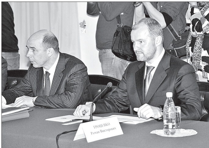
Заместитель министра финансов Антон Силуанов и президент ОАО «Объединенная судостроительная корпорация» Роман Троценко

понимаем, насколько это очень важно, и должны стараться».