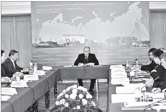
На совещании в Доме техники Севмаша