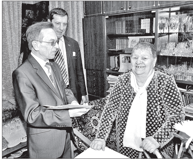
Приветствие юбиляру от Севмаша

Удостоверение к награде электросварщицы сопровождает запись: «За большие заслуги в деле создания и производства но-