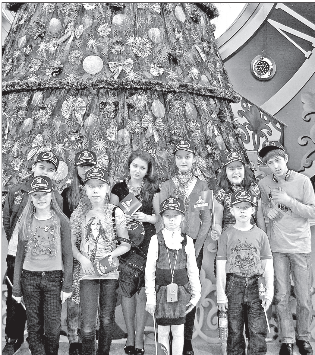
Дети корабелов на новогодней елке мэра Москвы

В этом году организация праздничных мероприятий вышла на новый уровень: слаженная команда профессионалов сделала все, чтобы ребята почувствовали трепетную заботу и были в полной безопасности. Сто четыре сотрудника милиции ежедневно охраняли покой детей; круглосуточно в 22-этажной гостинице «Молодежная»