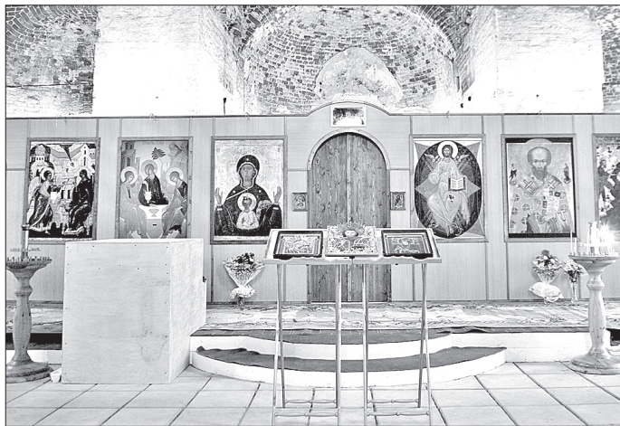
Временный иконостас Никольского собора