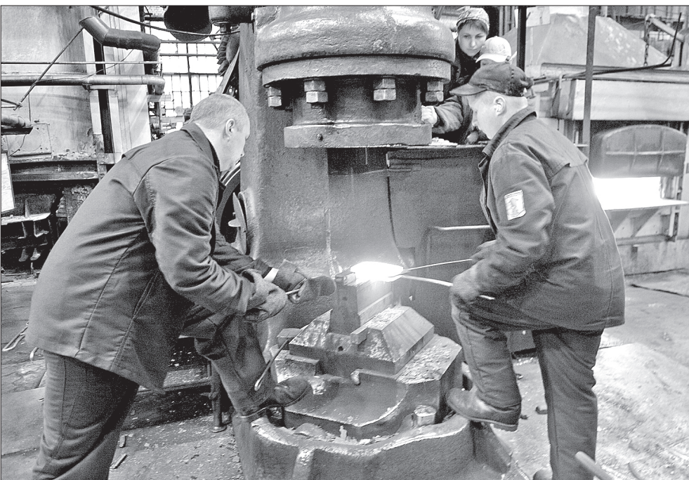
Цех 3: кузнецы куют металл