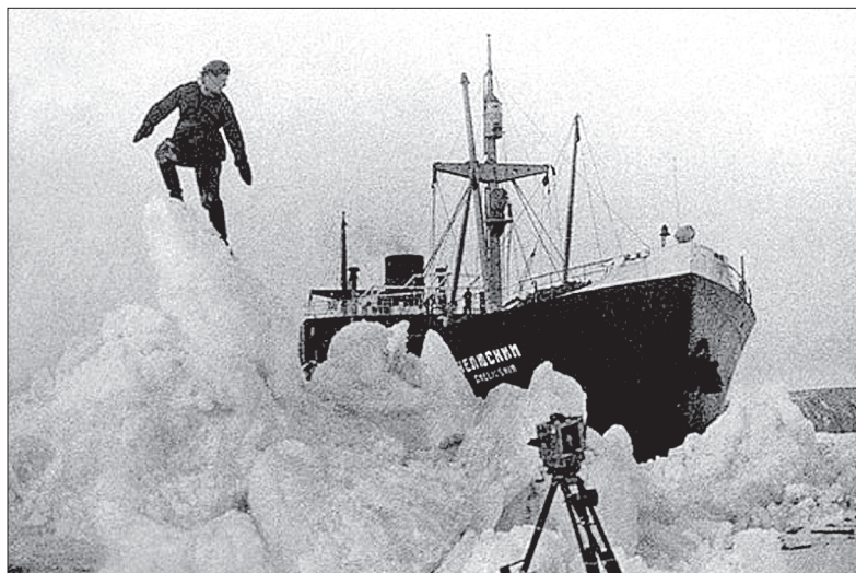
Раздавленный льдами пароход «Челюскин»

вых, мыс Дежнева, Берингов пролив, остров Шмидта, мыс Челюскин... К слову сказать, Челюскин мыс – это самая северная оконечность Азии на берегу Северного Ледовитого океана. Он был описан в декабре 1741 года штурманом Челюскиным, посланным для описи северного побережья Таймырского полуострова. А к юго-востоку от мыса лежат три небольших острова, которые также называются островами Челюскина.