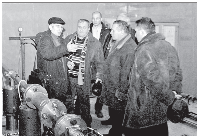
Делегация Севмашвуза знакомится с унифицированным стендом

к научным разработкам выпускников нашего учебного заведения, что повысит авторитет инженерных специальностей. Аналогичный опыт работы со «Звездочкой» показывает, что предприятию это приносит немалые дивиденды в научном и экономическом плане. Нам хотелось, чтобы на Севмаше трудились высококвалифицированные специалисты с научными