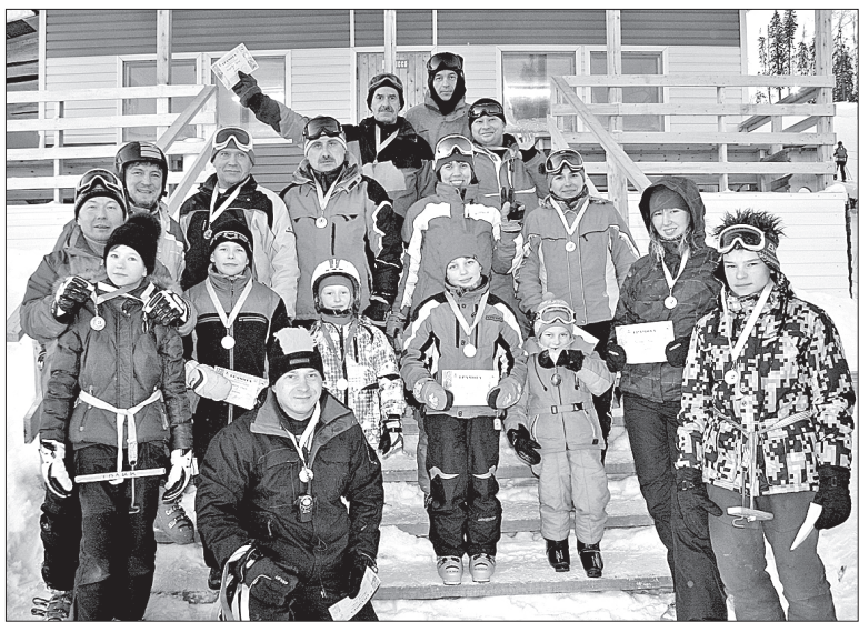
Призеры чемпионата Северодвинска по горнолыжному спорту и сноуборду