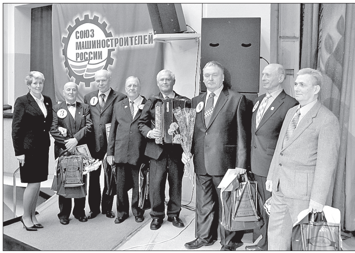
Участники конкурса и члены жюри.