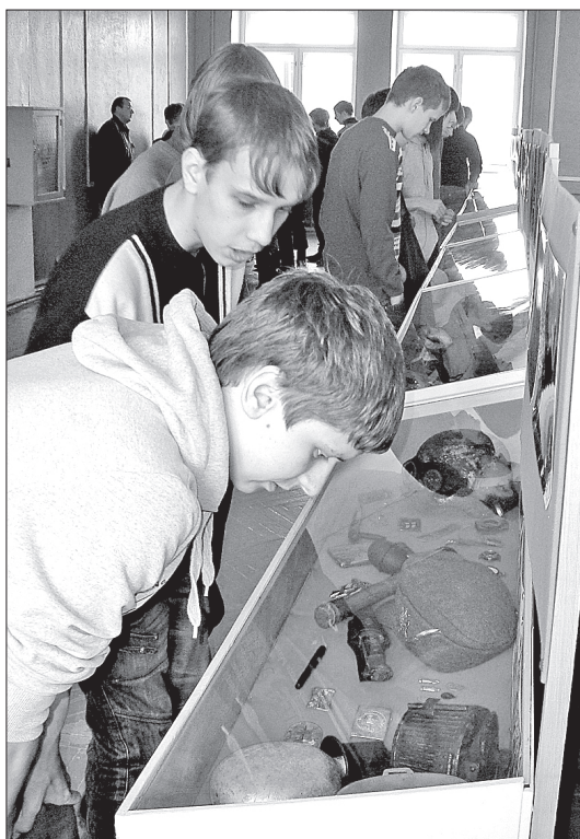
Экспозиция вызвала интерес среди учащихся

К Дню защитника Отечества в Северодвинском техническом колледже открылась экспозиция, на которой представлены свидетельства Великой Отечественной войны: форма, документы, награды, предметы быта солдат, вниманию посетителей предложены фотографии поисковой работы.