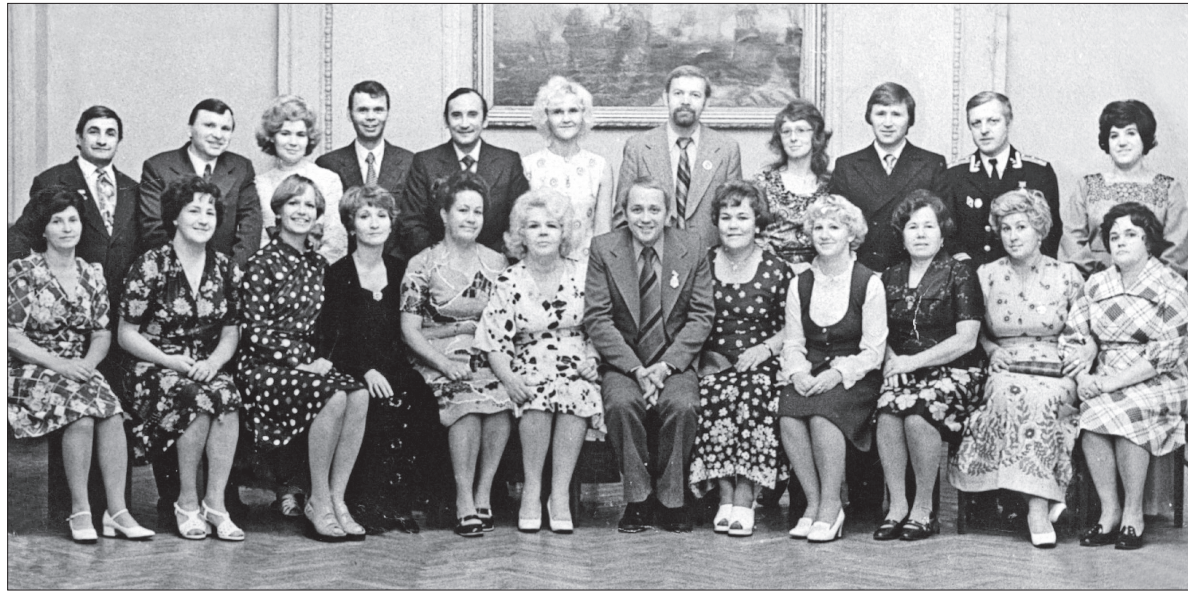
Дом техники: в гостях у коллектива агиттеатра известный телеведущий Александр Масляков

Свой вклад «Северянка» внесла в подготовку VI Всемирного