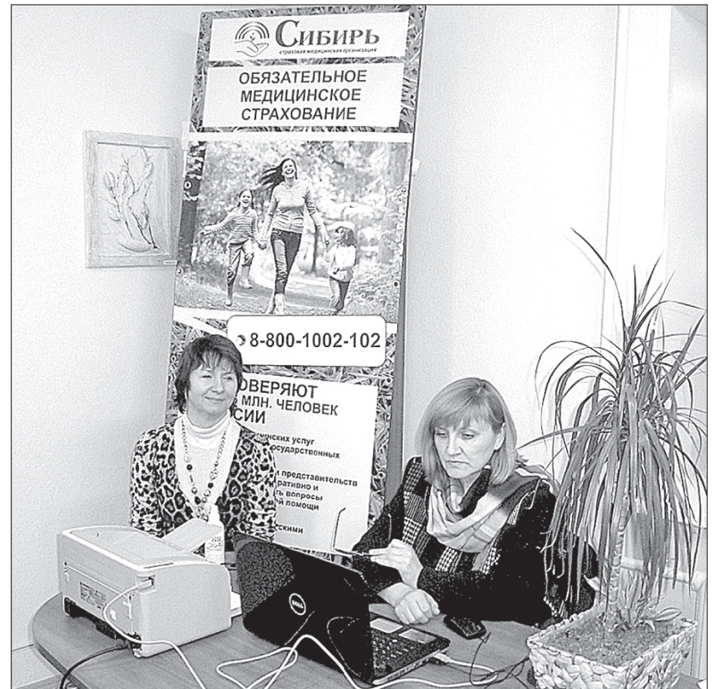
Кардиовизор наглядно покажет врачу, в каком состоянии ваше сердце

Архангельский филиал ОАО СМО «Сибирь» находится по адресу: г. Архангельск, ул. Воскресенская, 118 , телефоны: 8(8182) 20-36-26, 20-32-41. Консультативный центр: 8-800-1002-102 (круглосуточно, бесплатно). Адреса пунктов выдачи полисов в Северодвинске: • Архангельское шоссе, 38, каб. 115 (управление по социальным вопросам Севмаша), тел. 8-963-200-99-03; • Ломоносова, 35а, каб. 214 (совет ветеранов Севмаша), тел. 50-49-50; • поликлиника № 3 (пр. Морской, 49), регистратура, тел. 53-37-02. Режим работы с 8.30 до 17 часов.