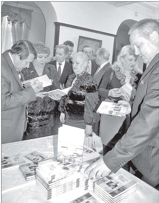
Книга вызвала большой интерес собравшихся