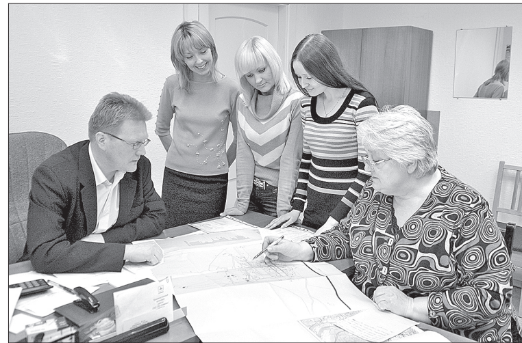
С поставленной задачей специалисты ОИЗ справляются