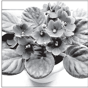
Светлана ФРОЛОВА. Фото из архива редакции.

Хозяйки этого великолепия консультировали интересующихся с особенностями выращивания и ухода за цветами. На выставке желающие могли приобрести понравившиеся им сорта фиалок, а также их листочки на рассаду.