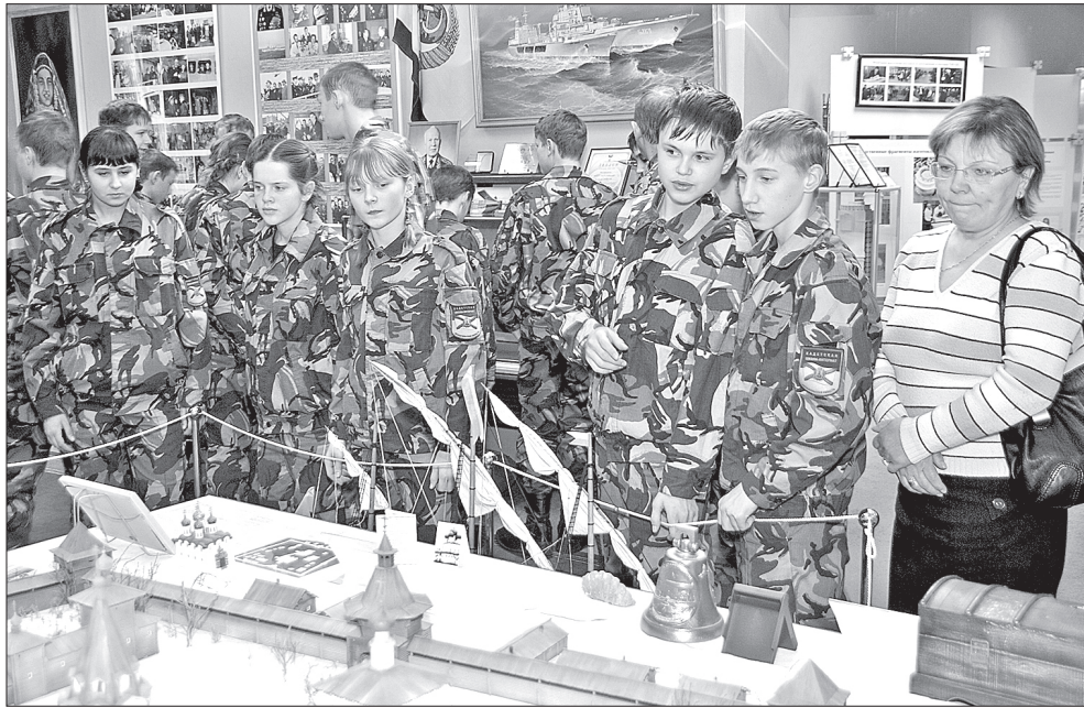
Сколько здесь всего интересного...

Кадетская школа-интернат создана в 2010 году по инициативе губернатора. В ней учится 160 человек – пятые-восьмые классы. Это дети со всей Архангельской области – сироты или находящиеся под опекуном, из малообеспеченных семей или родители