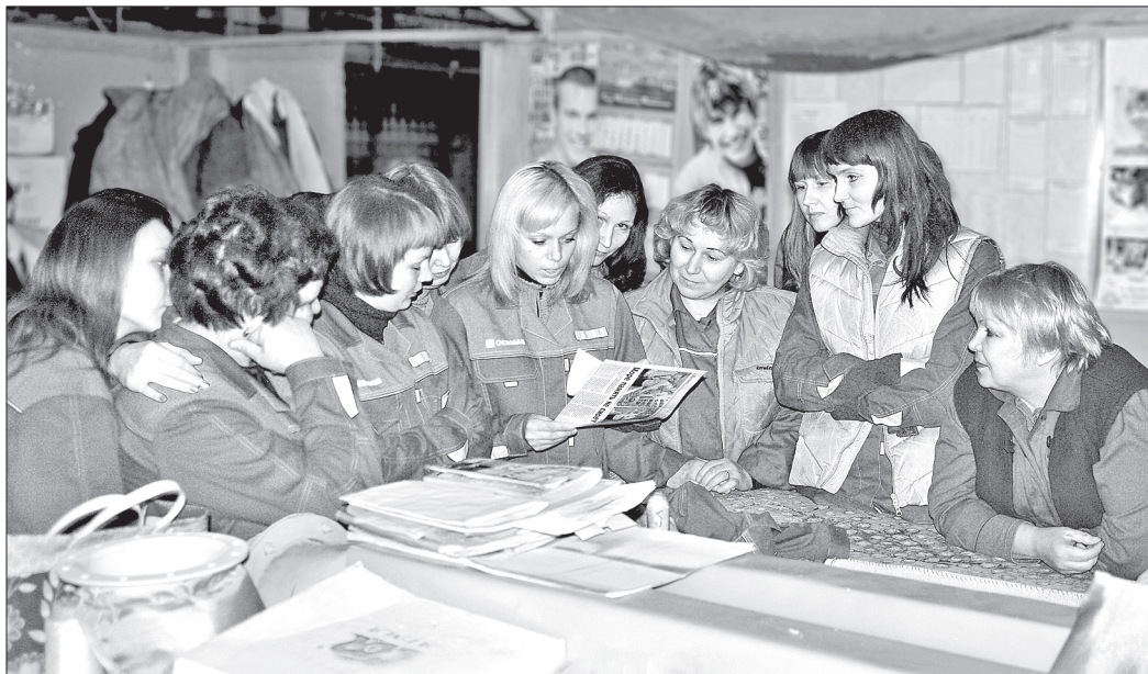
Про нас пишут!