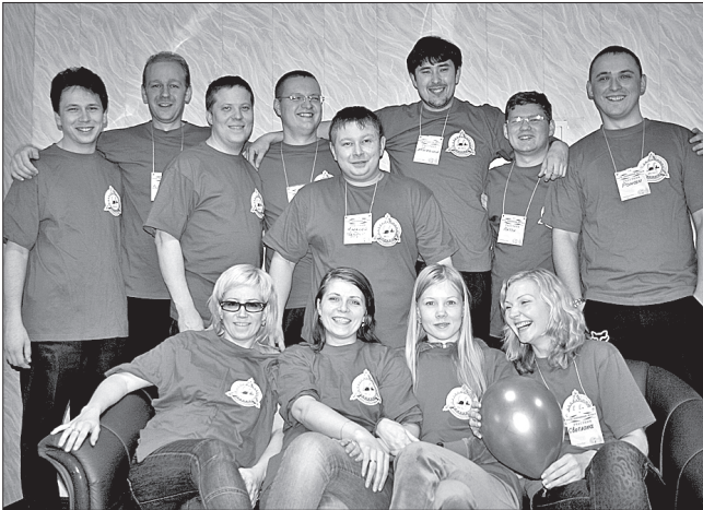
«Космическая» команда Севмаша

С 15 по 18 марта в Онеге состоялся седьмой форум молодёжных активистов. Тема по нынешним временам весьма актуальная: «Система молодёжного самоуправления как средство социально-экономического и инновационного развития города».