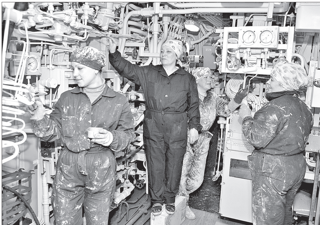
Маляры наводят глянец в отсеке подводного корабля

Для решения производственных задач на «Юрии Долгоруком» привлечены практически все участки цеха 43. Основная цель сейчас – качественно и в срок завершить окончательную отделку подводного крейсера. Учитывая внушительные размеры «Долгорукого», задача перед малярно-изоляционным цехом 43 стоит масштабная, и работа идёт полным ходом. Маляры, гумми-