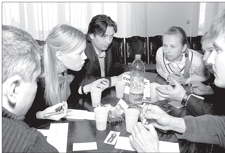
За игровым столом команда совета молодых специалистов «Друзья»