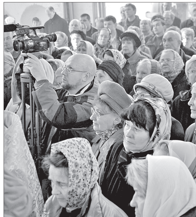
На Божественную литургию епископа Даниила пришли не только корабелы, но и не работающие на Севмаше горожане

Эта фраза стала лейтмотивом обращения к северодвинцам епископа Архангельского и Холмогорского Даниила. Божественную литургию владыка отслужил 1 мая в Никольском соборе бывшего Николо-Корельского монастыря, настоятелем которого он теперь является.