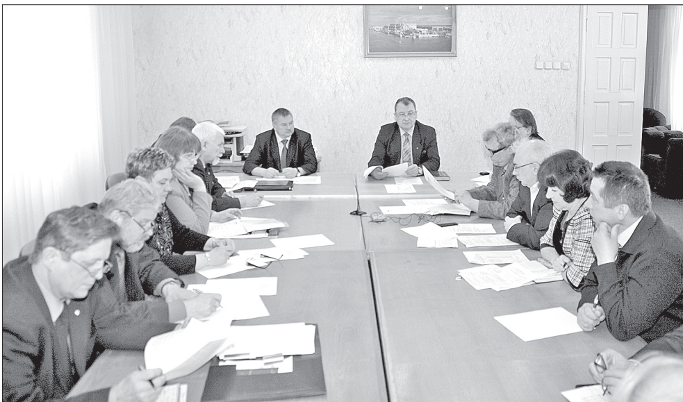
Идёт заседание центральной комиссии

29 апреля состоялось очередное заседание центральной комиссии предприятия по коллективному договору.