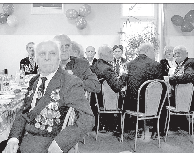
Бойцы вспоминают минувшие дни...