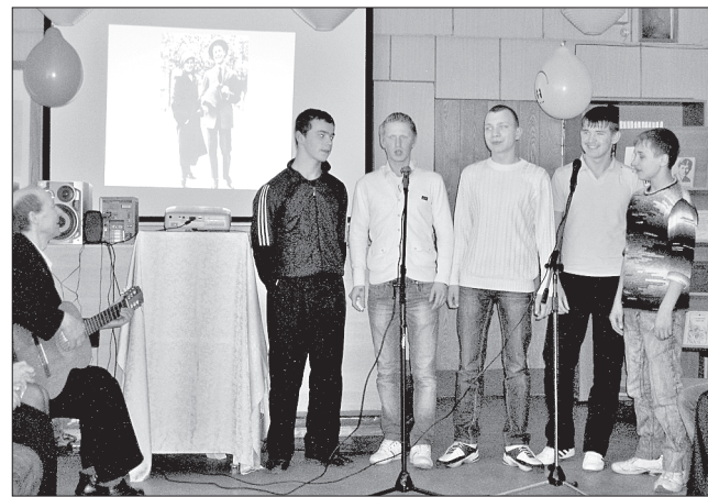
Учащиеся исполняли песни на стихи поэта

Учащиеся проникновенно читали есенинские стихи на русском, английском