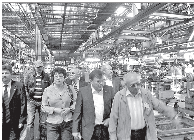
С экскурсией на главном конвейере АвтоВАЗа

Сообщаем также, что составляется постоянный список прихожан, желающих участвовать в богослужениях в Никольском соборе. Данные направлять на тот же номер с пометкой: «В постоянный список».