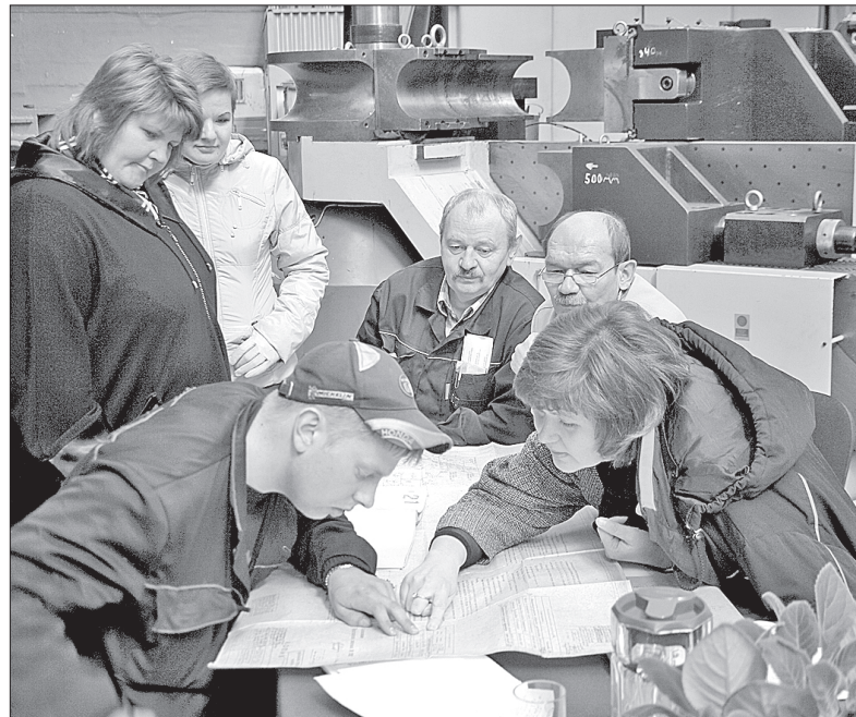
На вопросы конкурсной комиссии ответить было нелегко

Конкурсов профессионального мастерства в цехе 9 не было давно, хотя прежде они проходили регулярно. Прерванная ещё в середине восьмидесятых традиция возродилась в минувшее воскресенье: в трубомедном цехе прошли состязания судовых трубопроводчиков.