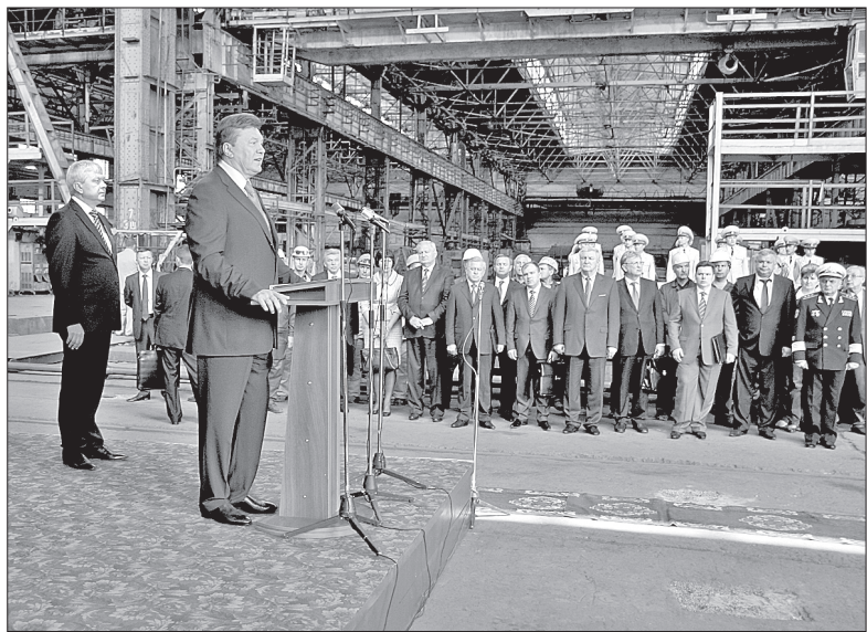
В церемонии закладки принял участие президент Украины Виктор Янукович