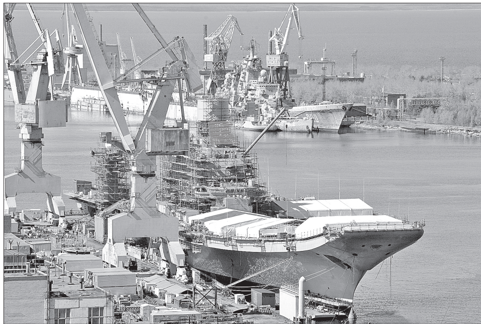
Приближается важнейший этап модернизации «Викрамадити»

Во всех строительных районах авианосца трудятся электромонтажники СПО «Арктика». Они заняты подключением оборудования,