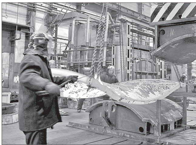
Горячая работа у пресса