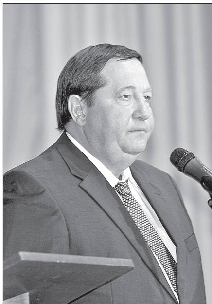
С приветственным словом к собравшимся обратился губернатор Архангельской области Илья Михальчук

Более 150 слушателей собрали «круглые столы». Темы об-