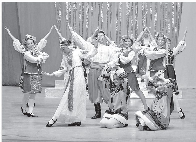
Перед участниками форума выступили лучшие творческие коллективы