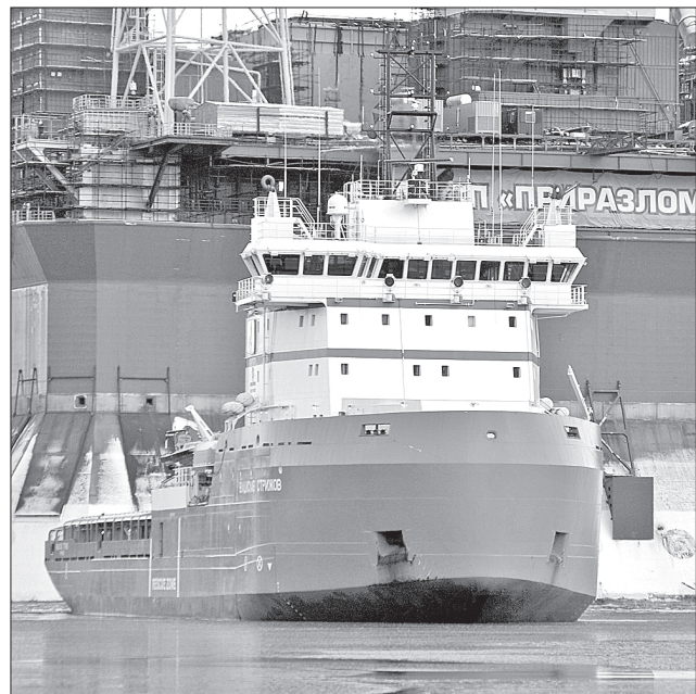
«В. Стрижов» регулярно доставляет грузы в Мурманск

Для экипажа судна ледового класса «Владислав Стрижов» маршрут от набережной Севмашпредприятия в Мурманск, где достраивается морская ледостойкая стационарная платформа «Приразломная», стал привычным.