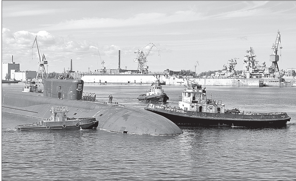
Суда водно-транспортного цеха и в будни, и в праздники несут трудовую вахту...