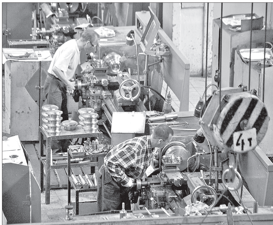
Для многих цех – как дом родной...

добранные стропа. Случались и отказы оборудования. Конечно, морально и физически устаревшего.