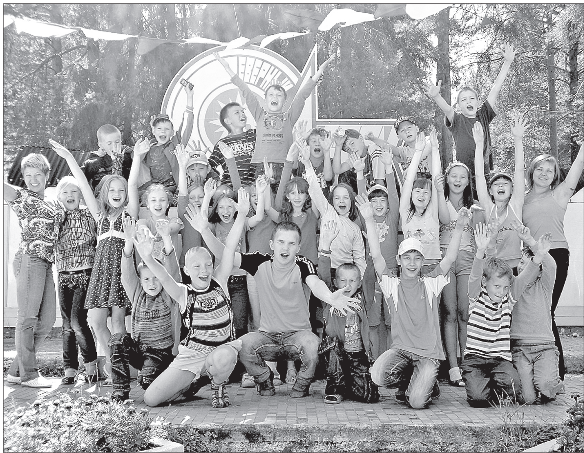
В заводском лагере ребятам очень нравится!