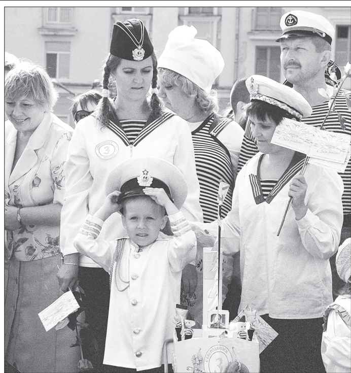
Так северодвинцы праздновали день ВМФ год назад