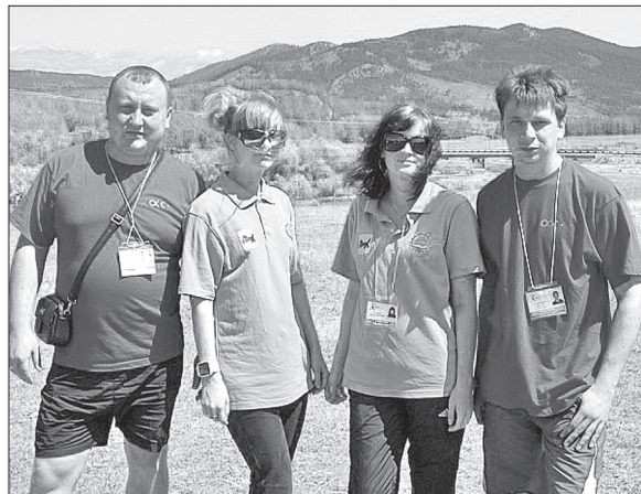
У побережья озера Байкал