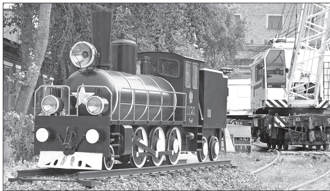
Макет паровоза перед цехом

сделать макет – символ их труда, побывали на ряде других железнодорожных предприятий, использовали материалы Интернета, и вот результат поиска и мастерства. Сияющий свежей краской и металлом миниатюрный паровоз, кажется, вот-вот тронется в путь. Только в тендере у него вместо угля малофракционный крашенный щебень. Зато его прожекторы с наступлением тёмного времени засветятся по-настоящему. В создании макета