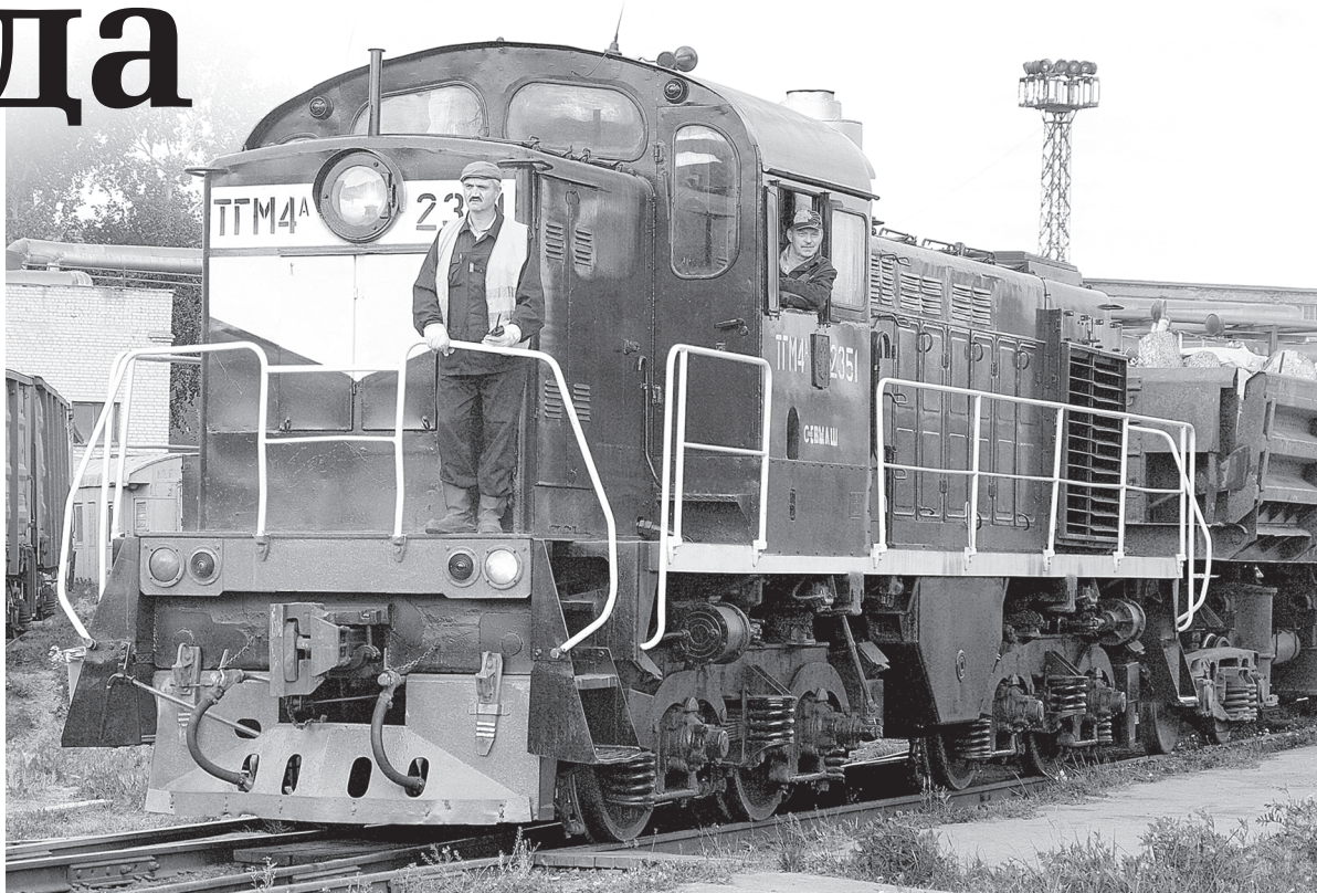
Состав отправляется на промзону

К тому же лето – пора интенсивного обновления железной дороги. «Мы благодарны администрации предприятия за внима-