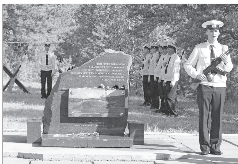
Город корабелов чтит память «Курска» и его экипажа

Сверхзвуковая скорость и большая дальность полёта ракеты обеспечивали АПЛ «Курск» возможность атаковать с расстояния, превышающего дальность обнаружения её средствами противолодочной обороны. Высокая скорость подводного хода, прекрасная маневренность и управляемость, большая глубина погружения и малозумность делали её неуловимой. А возможность залпа полным боекомплект из 24 ракет, космическое целеуказание и система обмена информацией ракетами в полёте обеспечивали избирательность и точ-