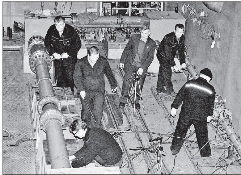
На унифицированном стенде идут испытания

Специалистами ОАСУП и НТУ при участии ОМТС разработана автоматизированная система управления и формирования производственных норм расхода материалов на заказах производства № 3 и управления ремонта, мо-