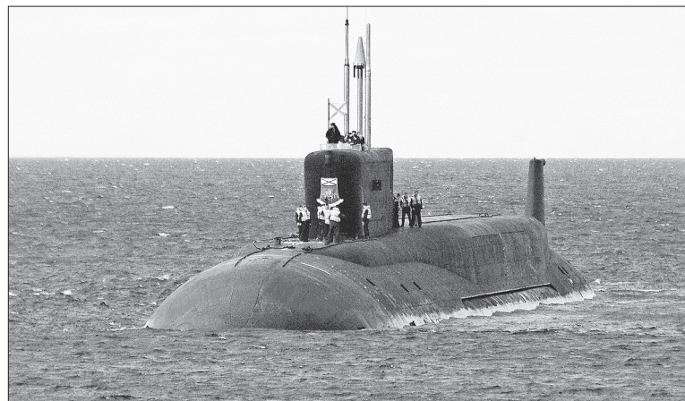
В эту навигацию «Юрий Долгорукий» совершил несколько выходов в море