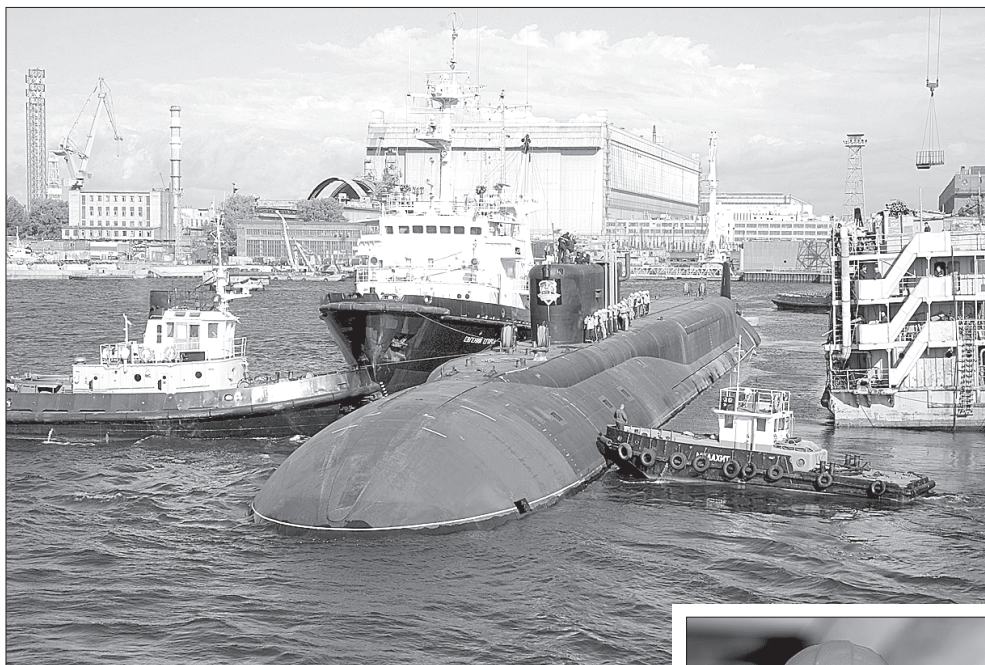
АПЛ «Александр Невский»