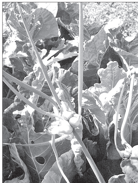
вном ярусе от четырёх и более луковиц». Вот что я узнал и вам рассказал.