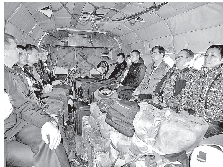
Курс на «Приразломную»: на борту вертолёта группа руководителей и специалистов

нию капитана платформы все 93 члена экипажа здоровы. С 5 октября будут формироваться вахты и возобновится монтаж кабеля и оборудования. 1 ноября планируем начать пусконаладочные работы по буровому комплексу. Проект на первые три скважины разработан».