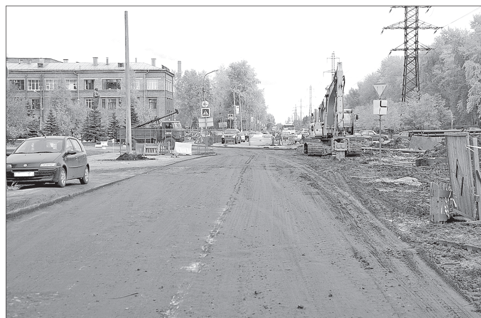
Возле заводоуправления работы идут полным ходом

Юрий АНАНИН.