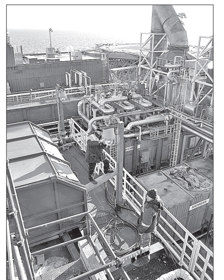
Идут наружные работы

И ещё Алексей Белый сообщил: вчера температура воздуха снаружи платформы была плюс пять гра-