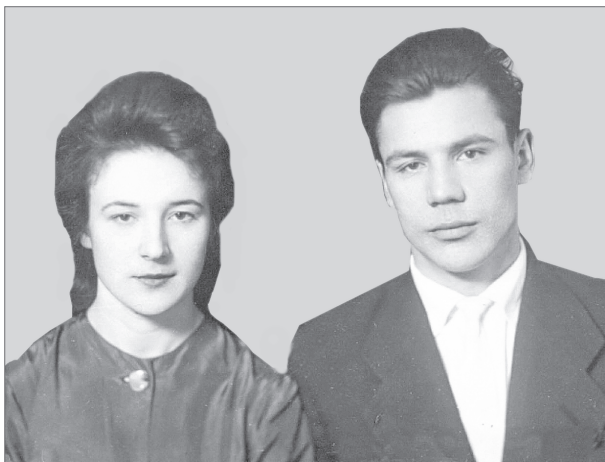
Как молоды мы были...

Когда-то давно эти двое сделали первый шаг навстречу друг другу. Признались в любви и, как водится, оставили автографы в книге записей актов гражданского состояния. А для заключения брачного союза выбрали весенний день 8 марта. Сегодня, спустя пять десятилетий, они готовятся отметить золотую свадьбу.