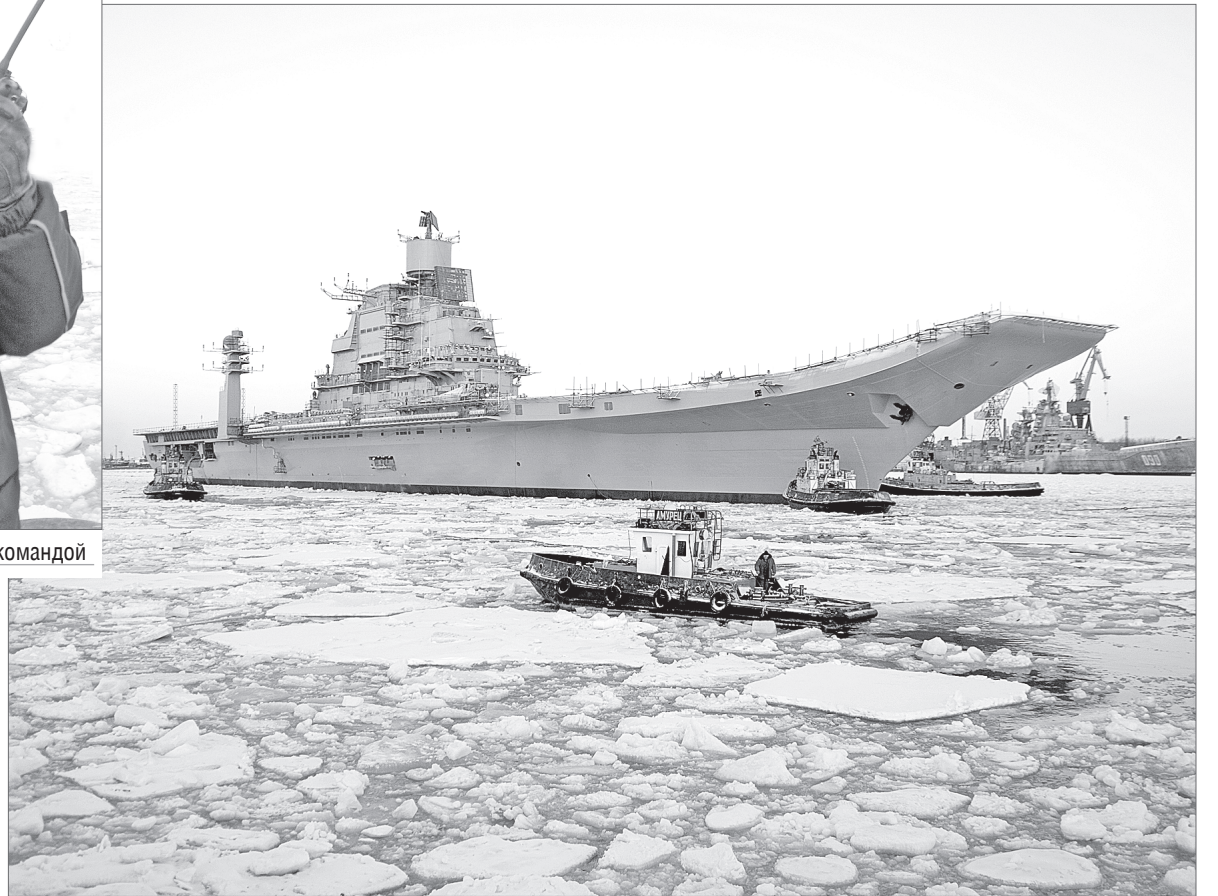
Заводские буксиры действовали чётко и слаженно

Тут же стало известно и о ближайших планах в строительстве авианосца: «Викрамадитья» будет «выставлен» по курсу «север – юг», затем инженеры и рабочие СБР, которым будут помогать суда водно-транспортного цеха,